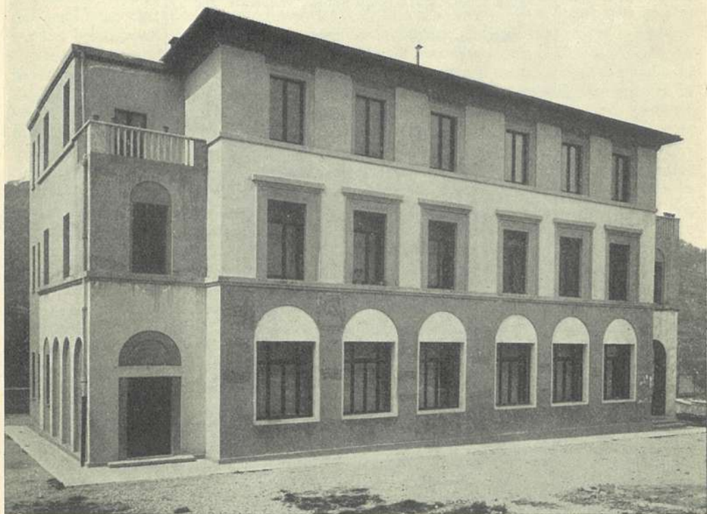
Nuove costruzioni scolastiche di Ascoli Piceno. Edificio scolastico del quartiere Luciani, edificio scolastico di Castel Trosino